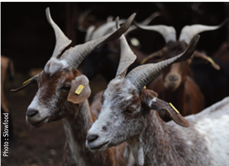
Troupeau du GAEC GOUIRAN